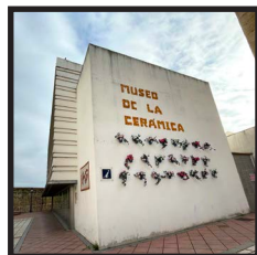
1. Museo de la Cerámica