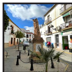
5. Plazuela de San Lorenzo