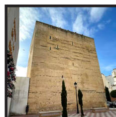
12. Torreón del Castillo