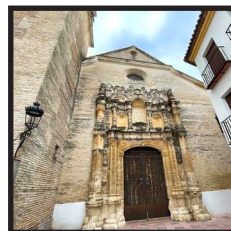
2. Parroquia de Nuestra Señora de la Asunción