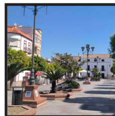
8. Paseo de España