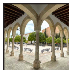
10. Convento de los Trinitarios