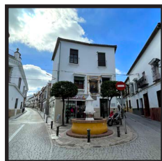
7. Plazuela Virgen del Pópulo