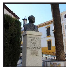
4. Plaza de Pepe Castilla