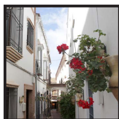
9. Calle de las Flores