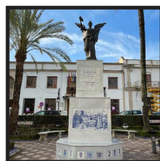
3. Plaza de la Constitución