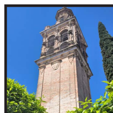
11. Torre de las Monjas